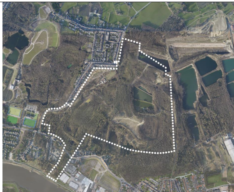
Fig. 1: luchtfoto met aanduiding plancontour

Het plangebied is voornamelijk gelegen in Rumst op de grens van Boom vlakbij de Schorre.